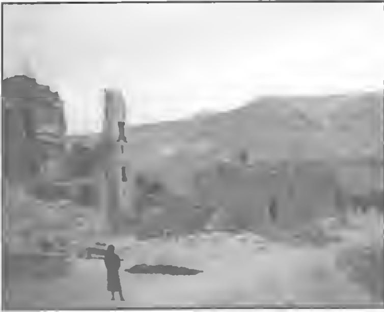
آثار من منزل الحبيب علي الجبشي في شحوح